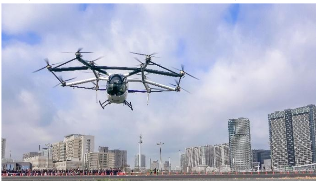
▲デモフライトの様子

3社は今後も、空飛ぶモビリティの社会実装およびサービス化に向けて、検討を進めてまいります。