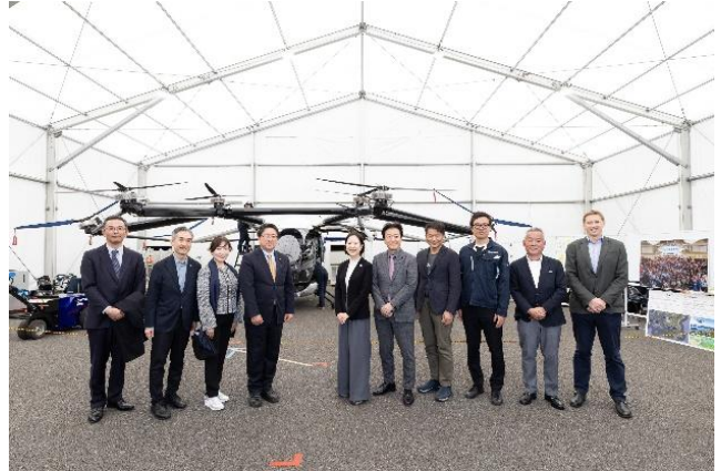
▲関係者および副知事訪問の様子 ※3