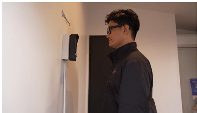
▲ターミナル実証の様子