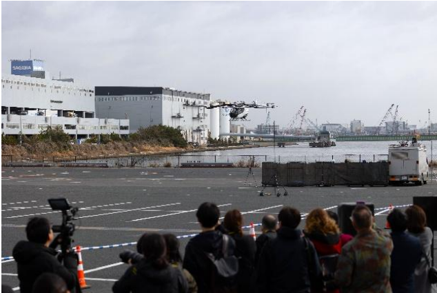
▲2月24日に開催されたメディアデーの様子