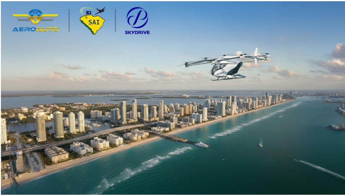
フロリダ州マイアミビーチを飛行する「SKYDRIVE」のイメージ